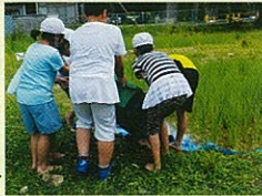
城東小学校 5年生 ▶