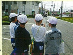
青木島小学校 6年生 ▶