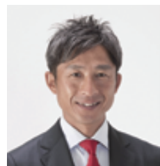
長野市長 荻原 健司